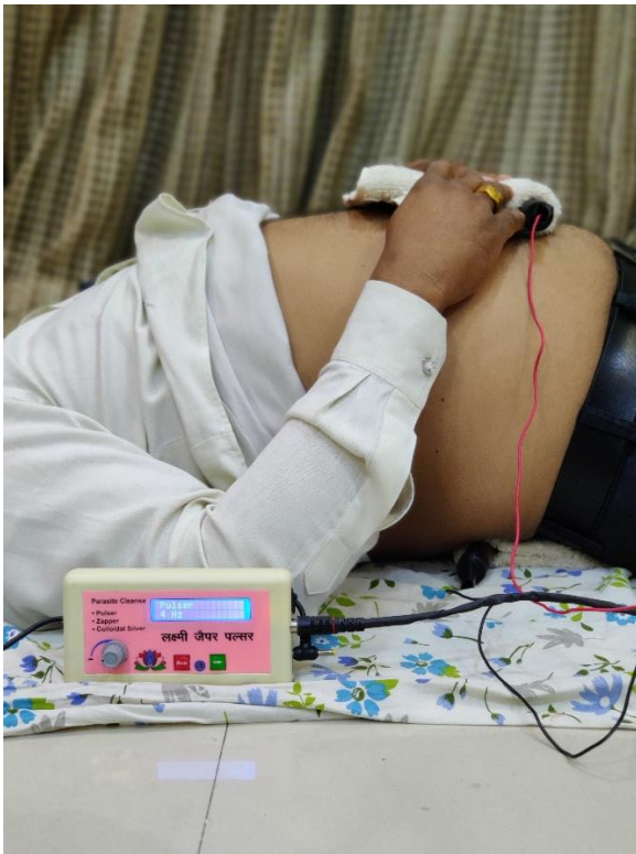
एक रॉड पीठ के नीचे और दूसरी पेट पर (पेट पर पोजीशन बदलते रहें)