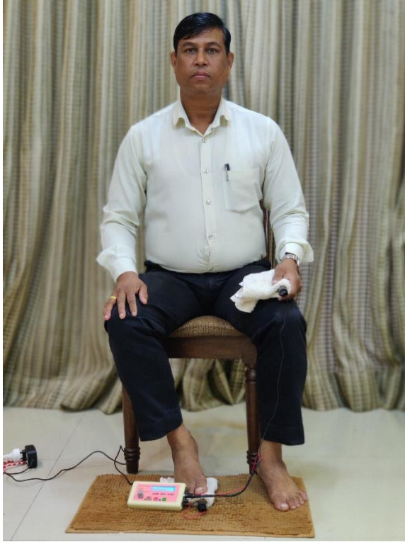
एक तांबे की रॉड बायें हाथ पर दूसरी दाएं तलवे के नीचे