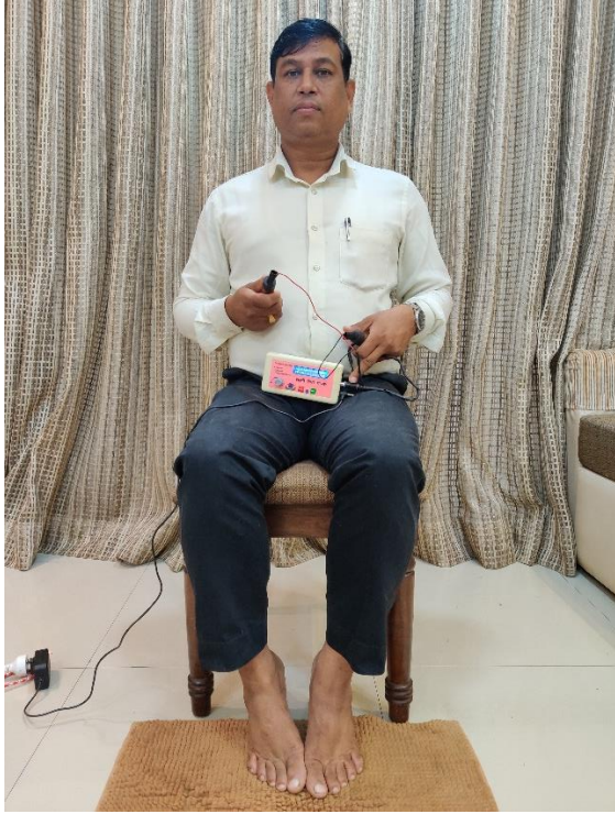
तांबे की छड़ें हाथ में हैं