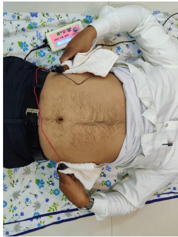
एक रॉड पेट के बायीं तरफ है तो दूसरी पेट के दाईं ओर है।