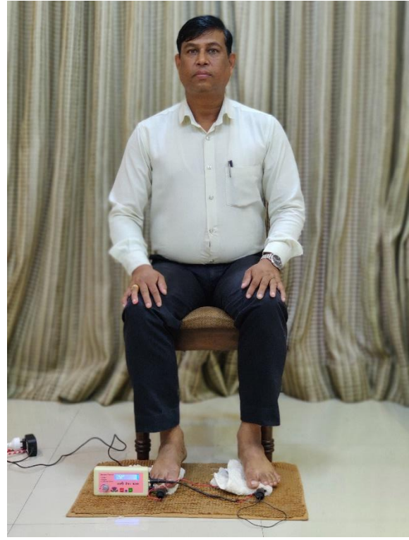
दोनों तांबे की रॉड तलवों के नीचे हैं